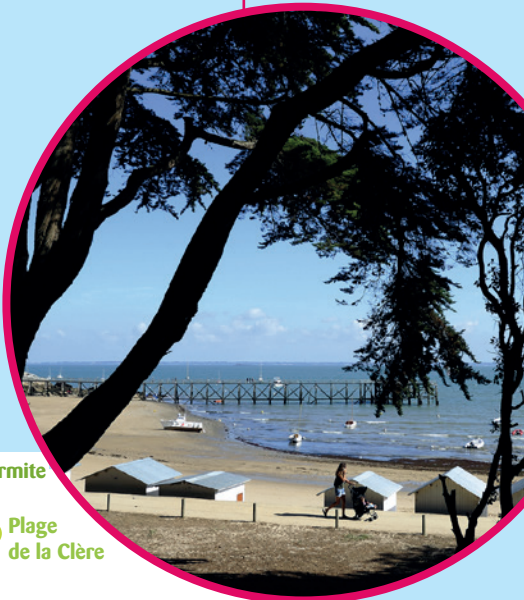
PLAGE DES DAMES